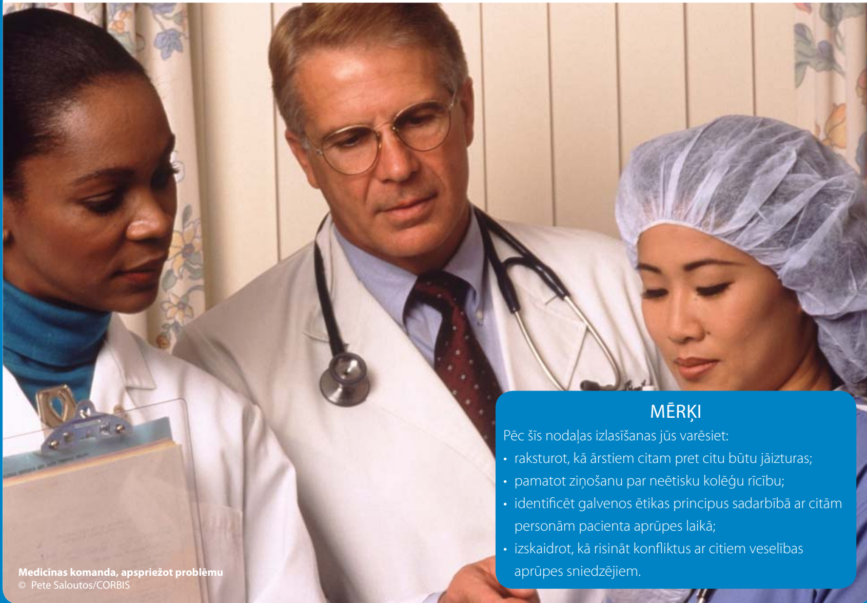
Medicīnas komanda, apspriežot problēmu