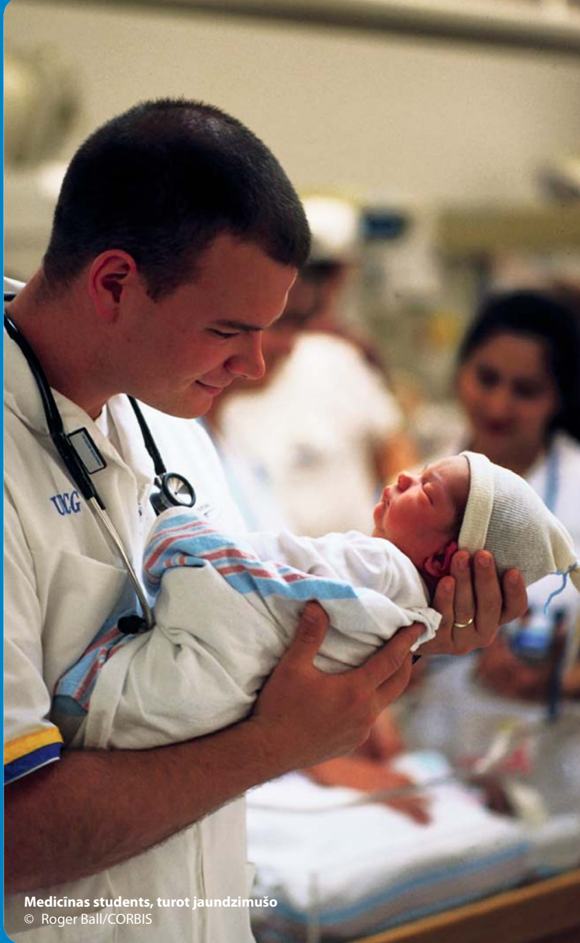
Medicīnas students, turot jaundzimušo