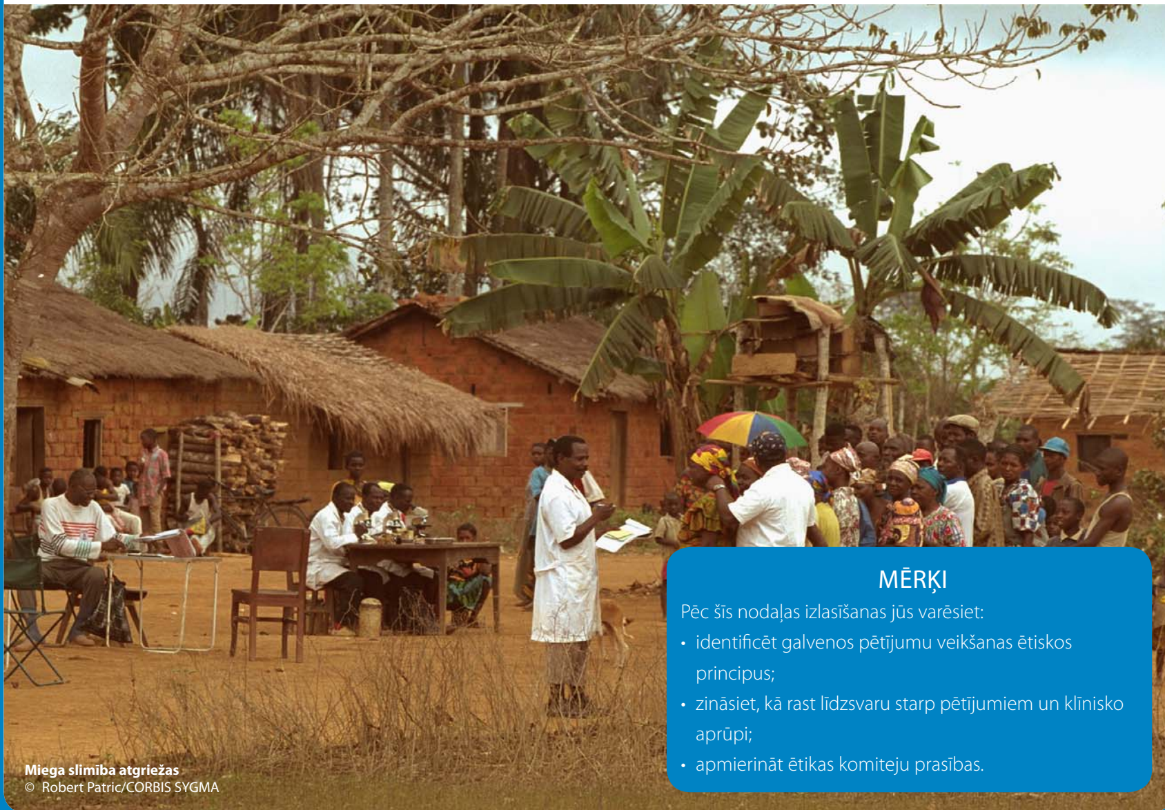
Miega slimība atgriežas