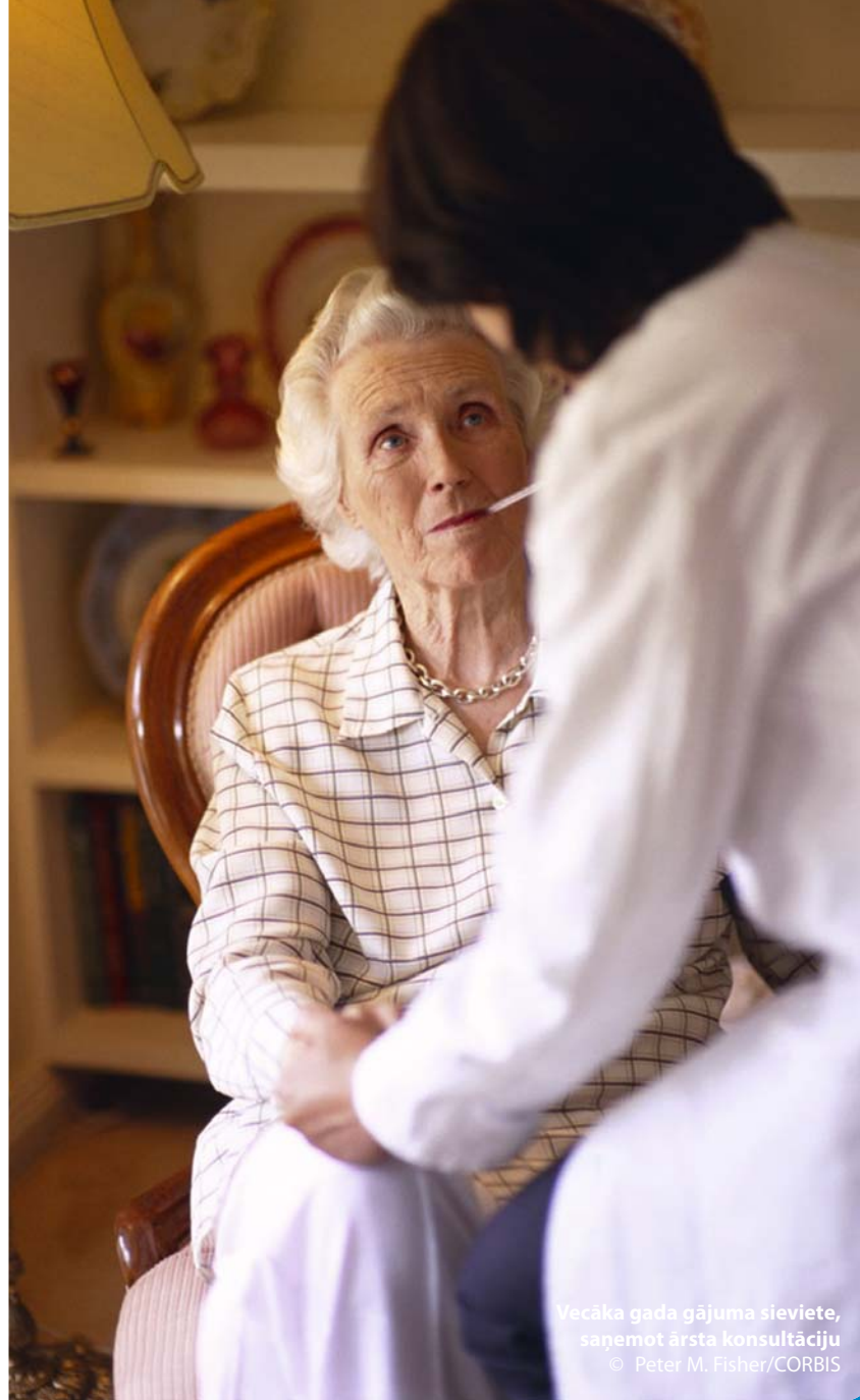
Vecāka gada gājuma sieviete, saņemot ārsta konsultāciju

Hārvardas Sabiedrības veselības skolas (Harvard School of Public Health) gadījumu izpēte — www.hsph.harvard.edu/research/bioethics/cases/