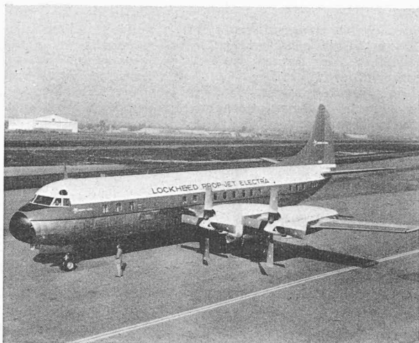
Fig. 2. — Vue du Lockheed « Electra », tel qu'il fut présenté à Cointrin. On remarque la forme caractéristique du fuselage ainsi que la position assez reculée de l'aile.