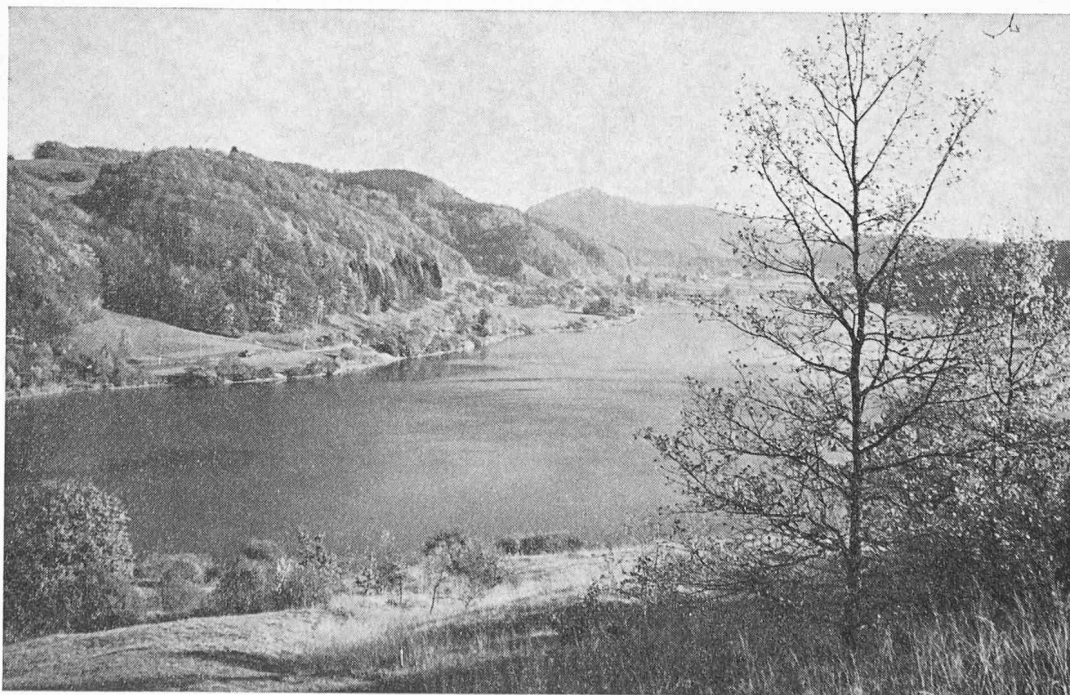
Fig. 2. — L'ingénieur forestier a un important rôle à jouer quand il s'agit d'ordonner le paysage dans les lieux de délassement.