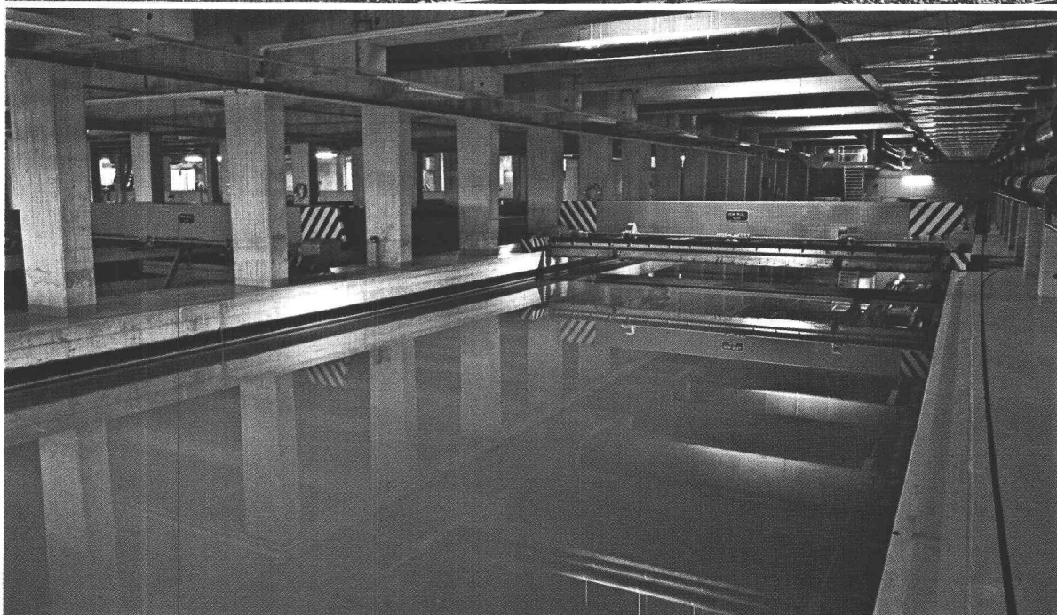
Station d'épuration des eaux à Vevey