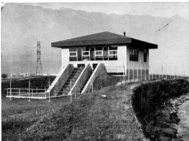
Station de relevage des eaux de décharge de la commune de Wilderswil.