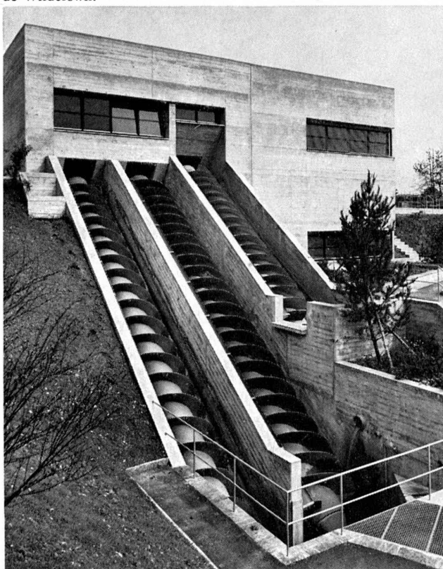
Station d'élévation pour eaux usées avec vis d'Archimède dans l'installation d'épuration de la ville d'Oltten.

Les engins d'élévation avec vis d'Archimède SPAANS constituent la solution idéale pour le refoulement d'eaux usées brutes et de boue. Les vis d'Archimède SPAANS sont fabriquées depuis plus de 50 ans et se caractérisent par leur robustesse et leur fiabilité.