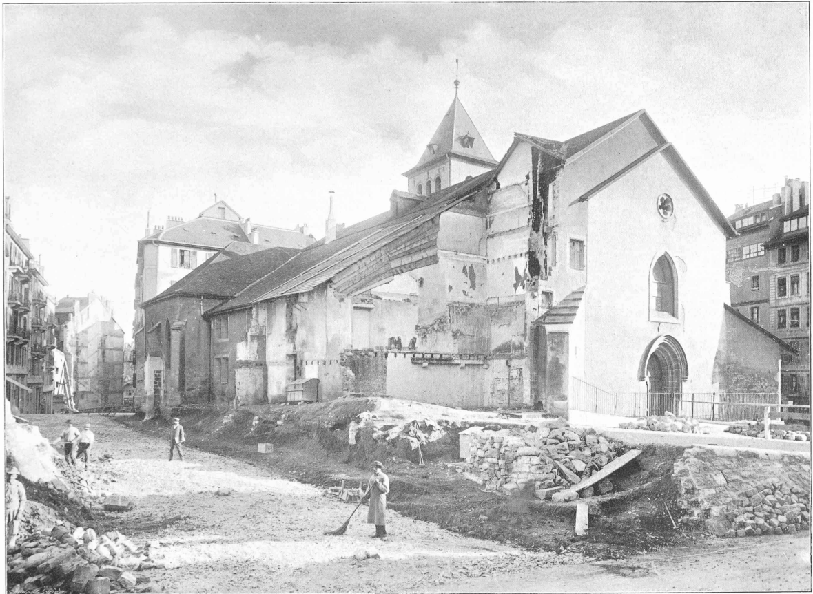
Gravure et impression S. A. D. A. G. — Genève