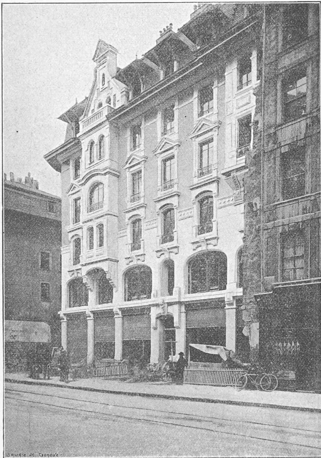
Immeuble construit par M. J. Tedeschi, architecte.

Situation : Rue de la Croix d'Or, angle rue d'Enfer. — Destination : Immeuble locatif. — Dimensions principales : 24 m sur la Croix d'Or et 15 m sur rue d'Enfer. — Observations : Façades : Roche de Villebois au rez-de-chaussée, pierre de Savonnière à l'entresol et au 1 er étage, pierre blanche d'Injoux aux autres étages. Plancher en ciment armé, système Kochen, sur les caves, solivages en bois et fer dans les étages. Couverture en tuiles émaillées provenant de Schaffhouse.