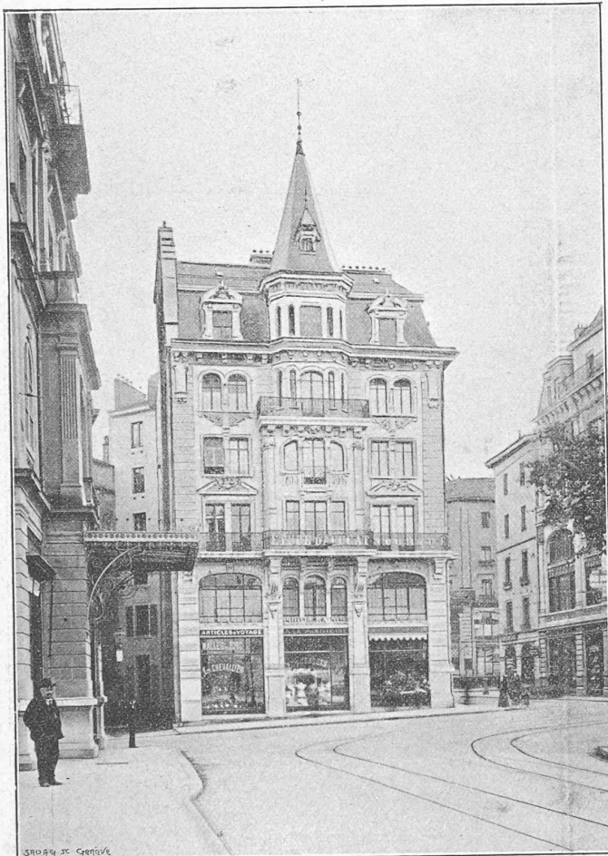
Immeuble construit par M. J.-E. Goss, architecte.

Situation : Place Bel-Air, 4. — Destination : Maison à loyers : Magasins entresol ; bureaux rez-de-chaussée, entresol, 1 er étage ; appartements, 2 e , 3 e et 4 e étages. — Dimensions principales : 13 m × 14 m. — Observations : Facès en roche pour le rez-de-chaussée et entresol ; en Savonnière et Morley pour les étages. Planchers tous en fer. Couverture ardoises et zinc. Eau, gaz, électricité, à tous les étages. Petite surface avec deux façades font ressortir le prix un peu plus élevé que le prix courant.