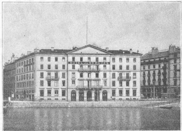
Fig. 2. — Ancienne façade.