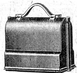
Niveau emballé, 1/6 grandeur naturelle

S. A. Henri Wild - Heerbrugg Téléphone 95 (St-Gall)