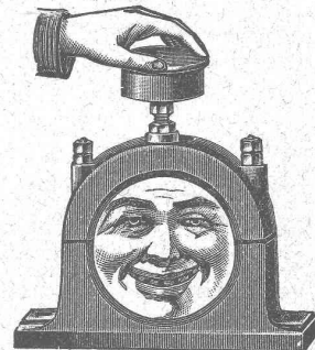
Palier refroidi pendant la marche au moyen de graisse ou de l'huile réfrigérante Brun.

Economie de temps, de force, de charbon et d'argent.