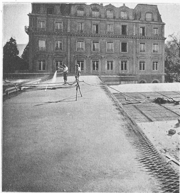
Fig. 3. — Pistolet en action.

Car, si la crise des transports est pour une part la conséquence d'une évolution de la structure sociale, politique et économique du monde, et pour une autre part la conséquence de techniques nouvelles, le problème qui se pose est d'une autre ampleur. Il ne suffit plus pour le résoudre, de faire des économies, d'ajourner, un temps, des dépenses indispensables, d'améliorer, dans le détail, l'emploi de l'outil actuel, d'augmenter les tarifs et d'alléger les impôts. Il faut reconstruire toute l'organisation des transports, moderniser les outils, moderniser leurs statuts.