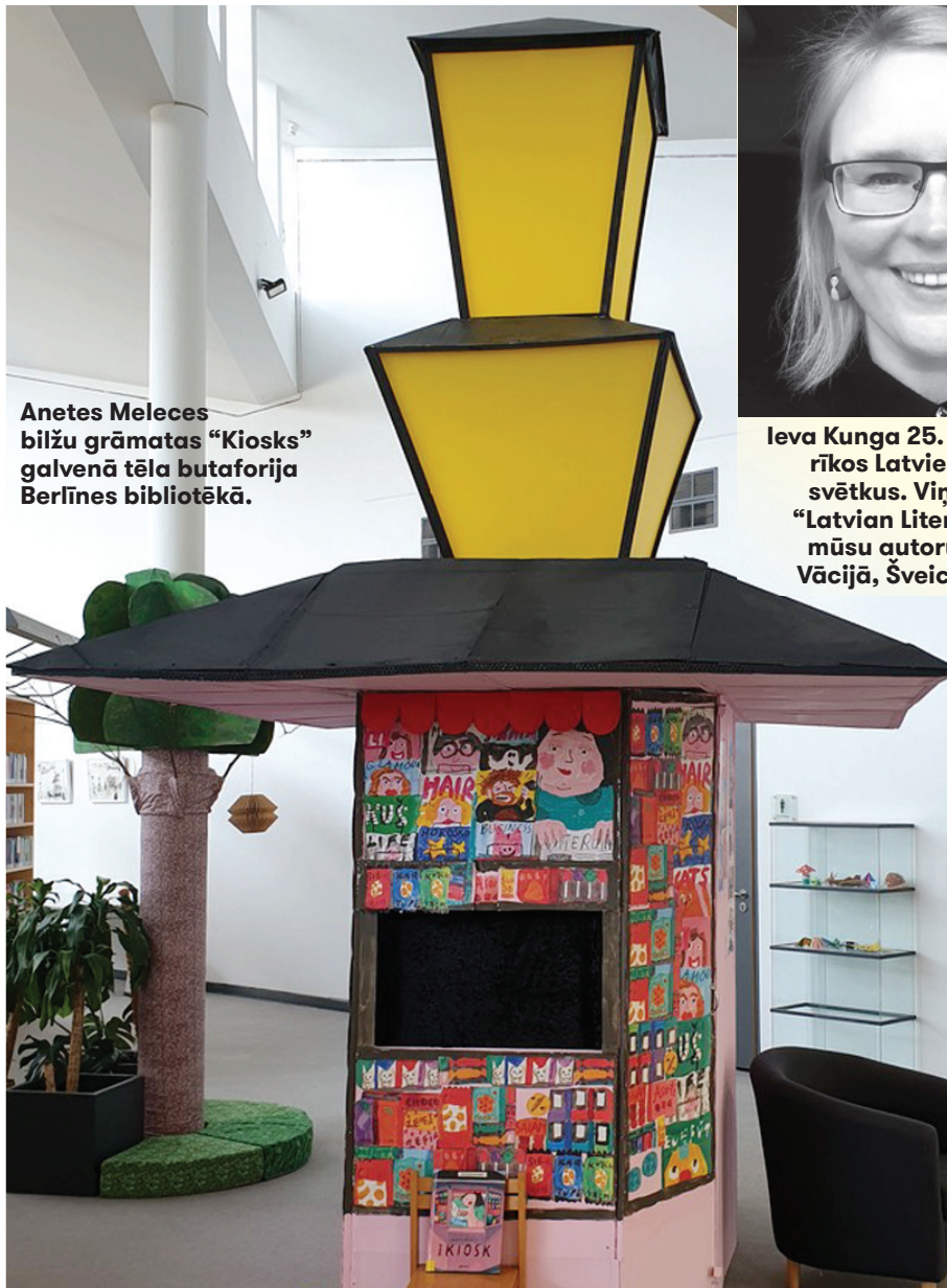
Anetes Meleces bilžu grāmata “Kiosks” galvenā tēla butaforija Berlīnes bibliotēkā.

Gandarījums esot par sadarbību ar ilustratoru Aneti Meleci, jo viņas bilžu grāmatai “Kiosks” galvu reibinoši panākumi – tulkota vairāk nekā 20 valodās, divus gadus pēc kārtas iekļauta pasaulē 100 izcilāko bilžu izdevumu sarakstā.