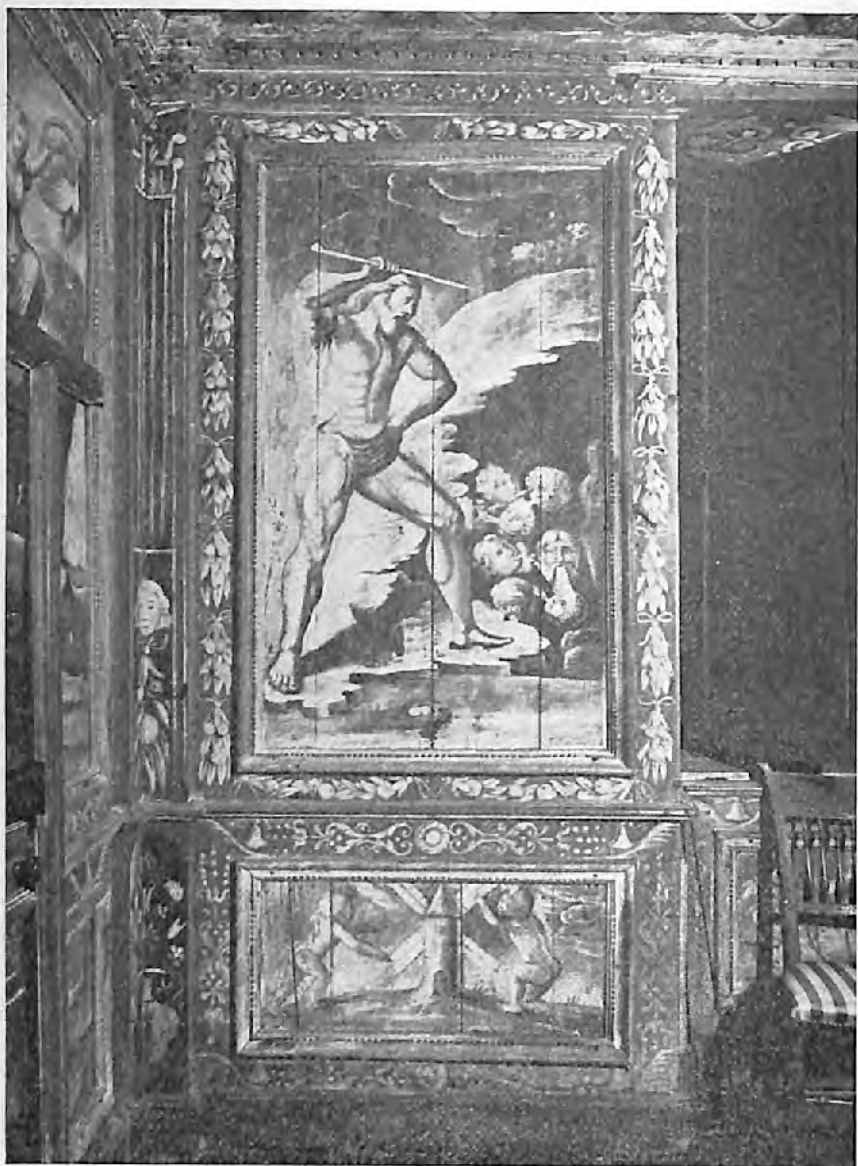
VIII. — Figure d'Eole.