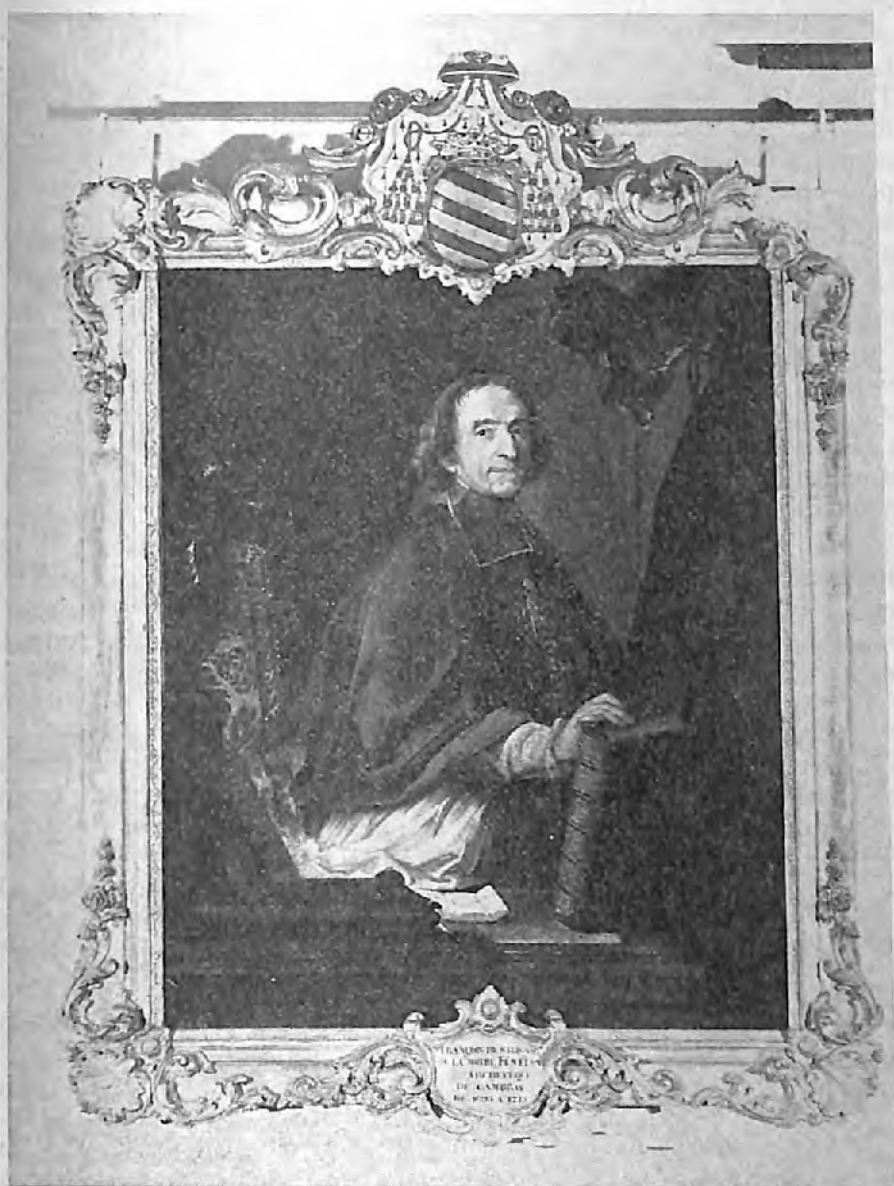
Fig. 3. — A. TAISNE, 1733. — Musée de Cambrai. (Cliché Giraudon).