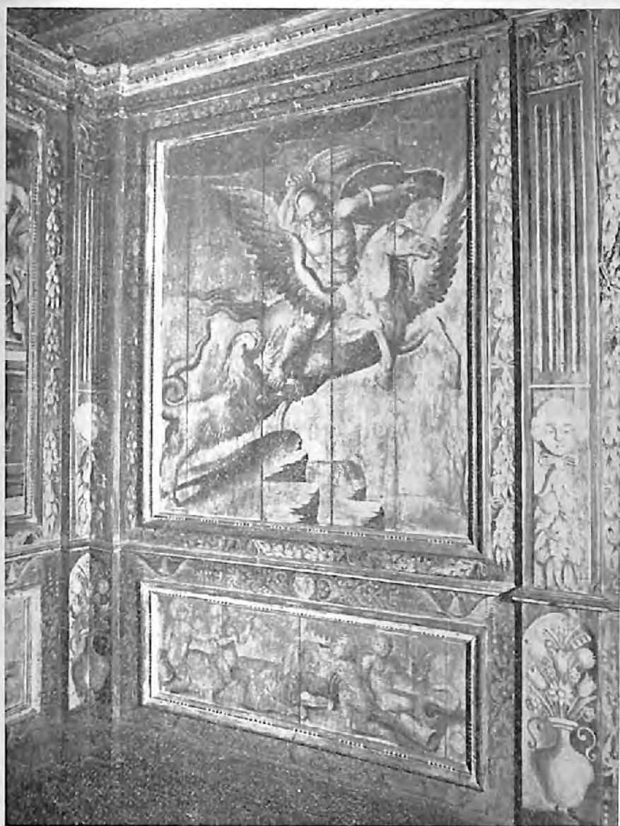
II. — Légende de Bellérophon.