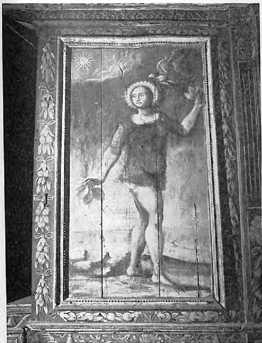
VII. — Figure de Clytie.