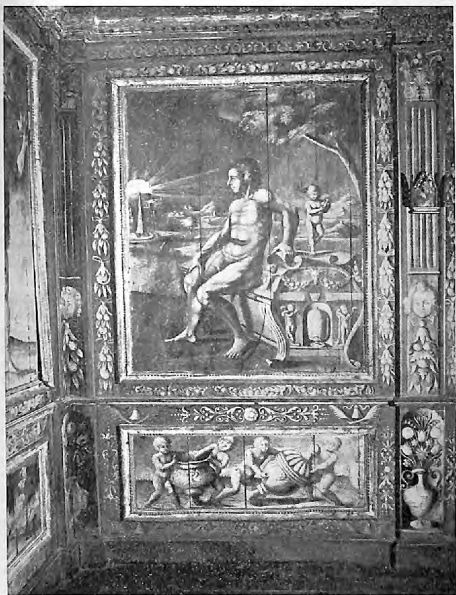
VI. — Personnage non identifié.