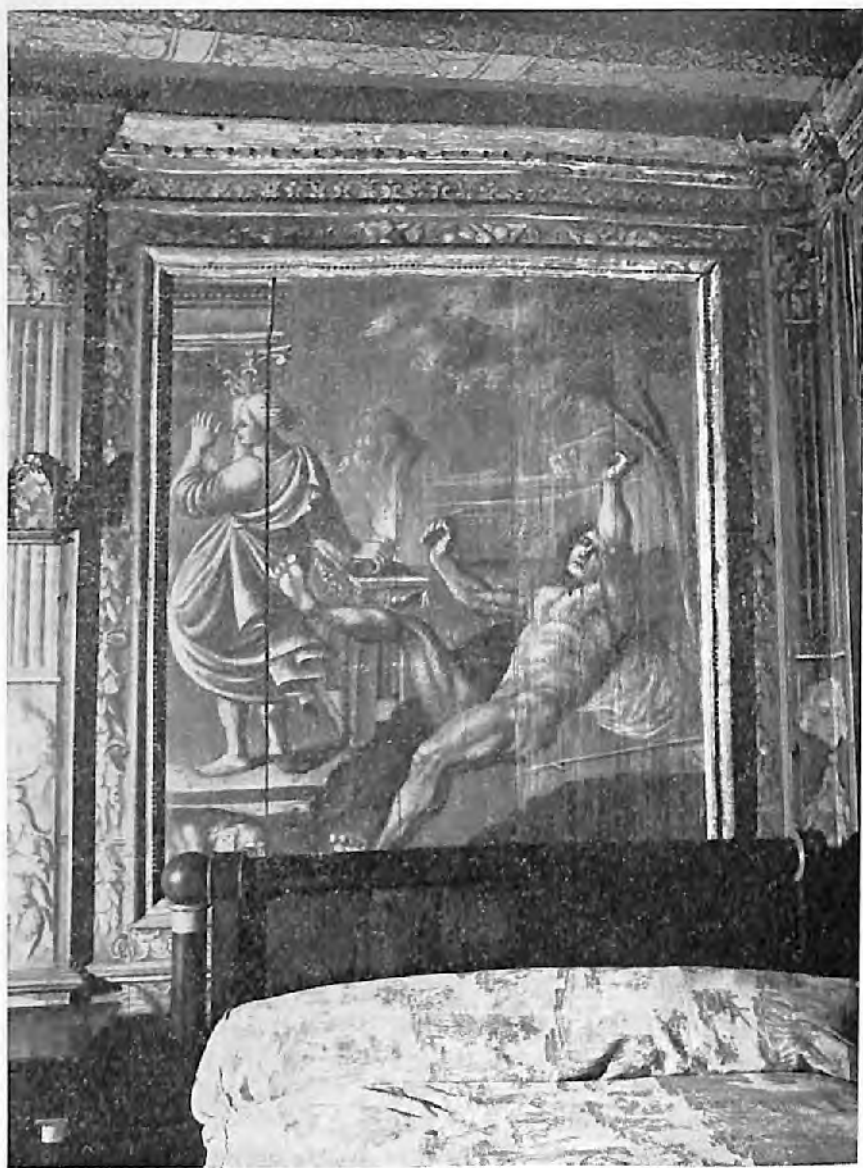
V. — Légende de Méléagre.