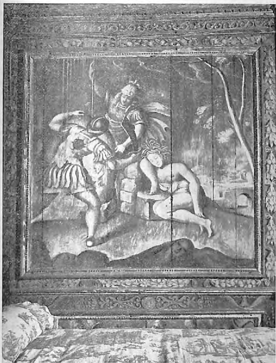
IV. — Légende de Persée.