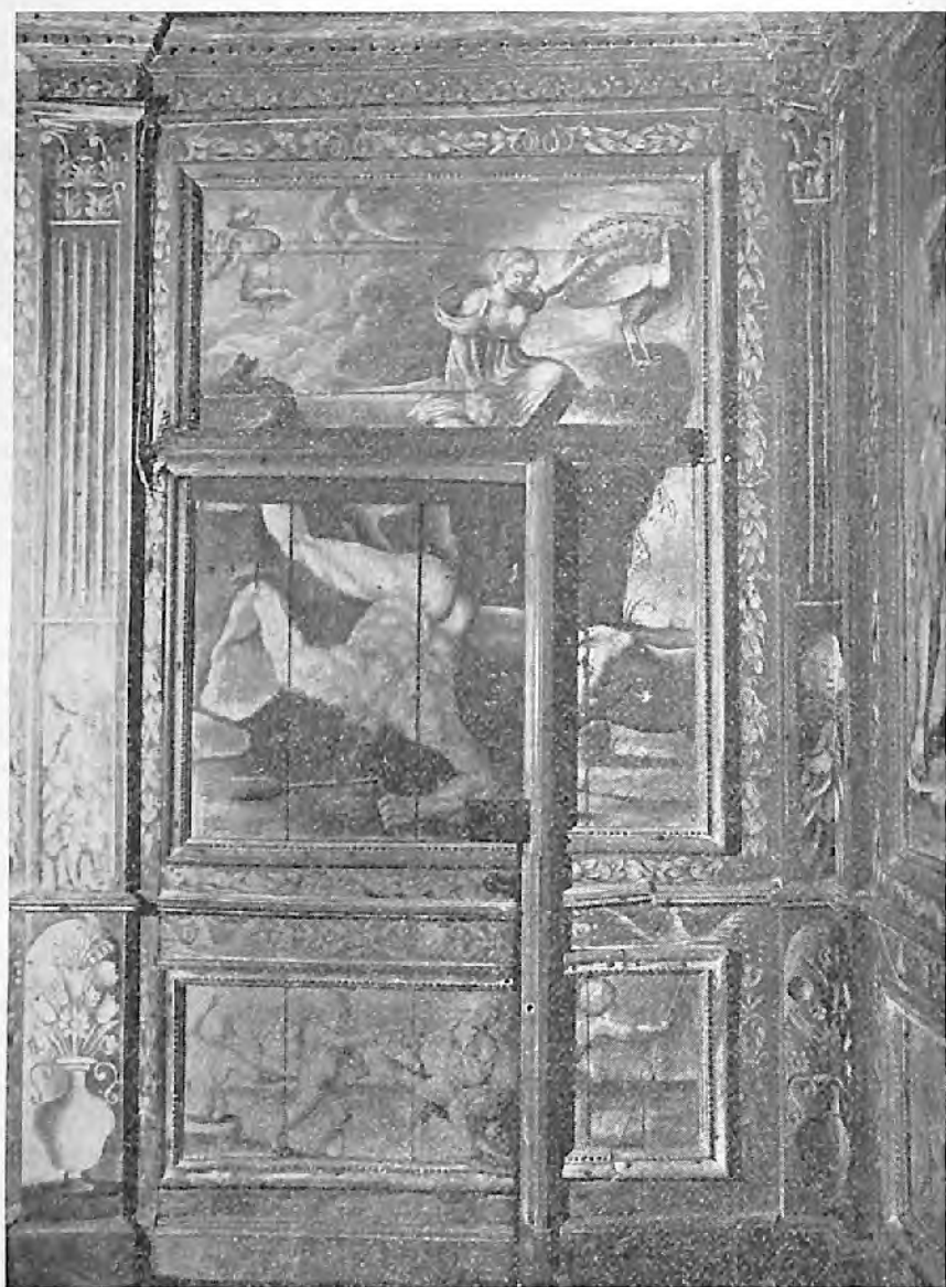
I. — Légende d'Argus.