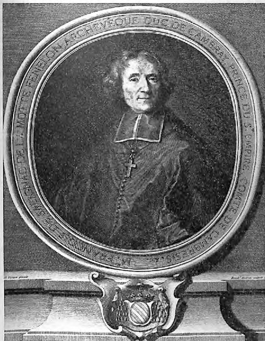
Fig. 2. — AUDRAN, d'après VIVIEN, 1714. — Musée du Périgord. (Cliché Gauthier).