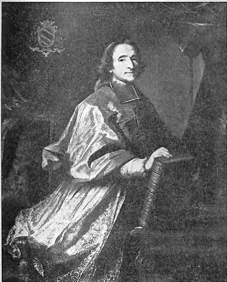
Fig. 1. — F. BAILLEUL, 1718. — Musée du Périgord. (Cliché des Musées nationaux).