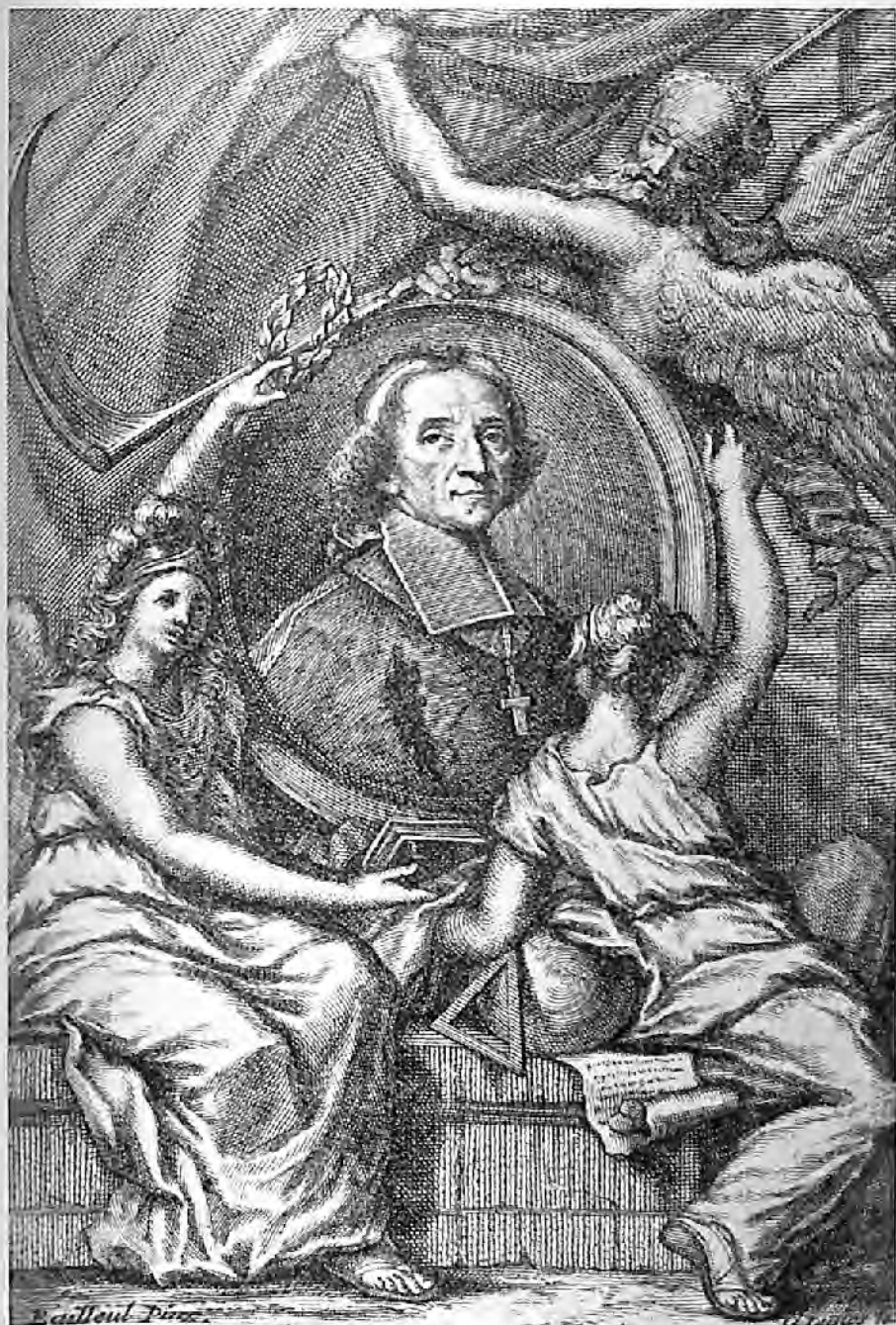
Fig. 4. — DUFLOS, d'après BAILLEUL, 1717.